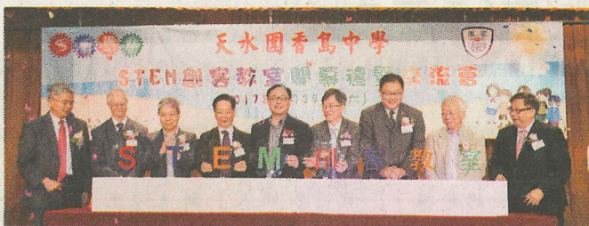
●天水圍香島中學STEM創客教室揭幕。

香島中學、天水圍香島中學、將軍澳香島中學堅守「以教學為核心」的辦學理念，致力建設高效能優質學校。在三校共同努力下，學生於中文憑試屢獲佳績，入讀本地、內地及海外知名學府比率持續攀升。