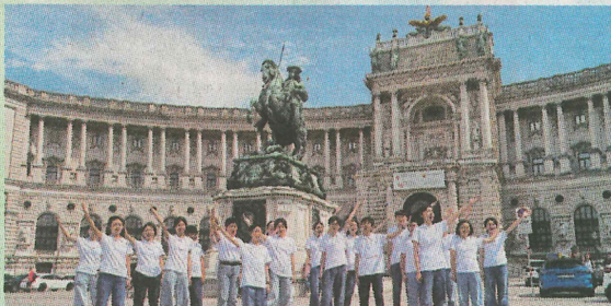
●香島中學學生於維也納街頭表演。

我們相信，「讀萬卷書」更要「行萬里路」。真正的學問，在書本的字裏行間，亦在世界的廣闊體驗中。我們鼓勵學子深耕經典，汲取智慧；同時邁向遠方，在實踐中印證與發現，領略學海無涯。