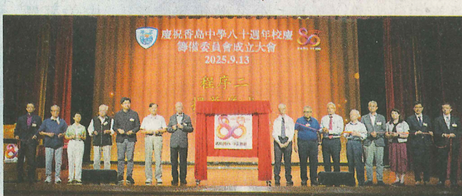
●八十周年校慶籌備委員會成立大會揭幕禮。

2025年9月13日，香島教育機構「慶祝香島中學八十周年校慶籌備委員會」成立大會在香島中學隆重舉行。逾二百名校友、嘉賓及籌委會成員齊聚一堂，共同見證香島人初心不變、團結創新的精神。